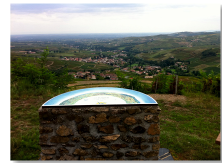
Table d'orientation à la Madone